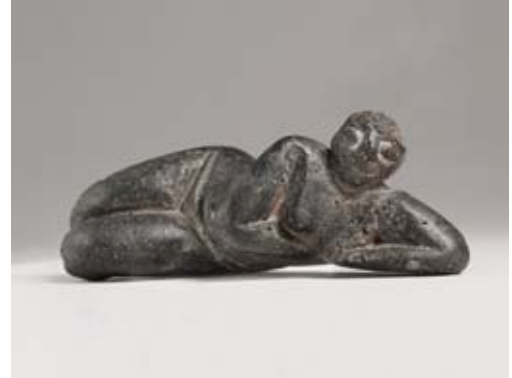
Déesse Couchée aux formes stéatopyges Néolithique Anatolien, VI e millénaire avant J.C. L : 8.4 cm

L'ensemble des pièces présentées, de la statuaire grande nature ou miniature, des reliefs, des vases ou des mosaïques, figurant différentes formes sous lesquelles, les Anciens ont conjugué le concept de divinité au féminin. Les objets illustrent une chronologie qui va du néolithique à l'Antiquité classique et des régions aussi différentes que l'Asie occidentale, la Mésopotamie, le Levant, l'Anatolie et le monde gréco-romain.