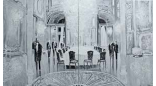
Frédéric CLOT, Honorariat , 2009 Huile sur toile 185 x 320 cm

La peinture est-elle en voie de disparition ? Non, elle meurt et renaît sans cesse, par l'entêtement et la magie des peintres. La peinture est vivante, elle résiste à tous les schémas théoriques et propose une plongée sans arrière-pensée dans le plaisir et l'intelligence de la vision.