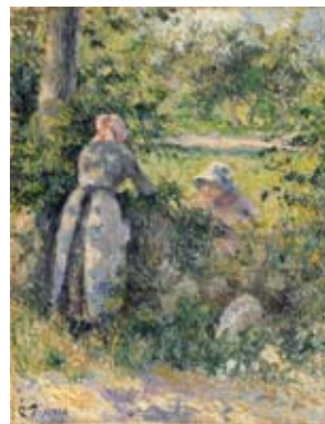
Camille PISSARRO, Paysannes causant , vers 1888 Huile sur toile, 35 x 27 cm

La Galerie Interart exposera une quinzaine de tableaux de maîtres sur le thème du « plein air ». Des œuvres de Bernard, Gauguin, Marquet, Picasso et Pissarro entre autres illustrant cette thématique de scènes de vie urbaines ou de campagne. Le sujet, révolutionnaire pour l'époque et rendu possible pour les impressionnistes, notamment influencés par l'usage de la photographie est représenté par le travail des paysans, comme dans cette très belle œuvre de Pissarro, Paysannes causant , mais aussi dans la vie mondaine parisienne et les dimanches champêtres en famille. Cette thématique sera ensuite développée par les générations suivantes avec la réalisation de fabuleuses scènes de vie, témoins d'une époque. A découvrir jusqu'en janvier 2010.