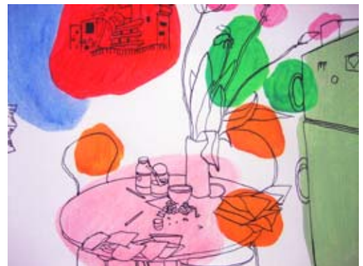
Pascale FAVRE, Llegando Tarde , 2008 Acrylique sur toile 114 x 146 cm

« Les microcosmes de Pascale Favre sont des natures mortes, bien sûr, mais leurs dispositifs se présentent en matière vivante et changeante. (...) Chaque table est un paysage accidenté par l'érosion du quotidien, résultat et étape de l'usage de ce petit monde. Elle nous renvoie avec ses objets et ses traces d'action à l'usager, celui qui construit consciemment et inconsciemment son microcosme de lui-même dans lequel le design intérieur, soit la paresse, le stress, la contemplation etc., devient le décor extérieur. » Thomas Schunke