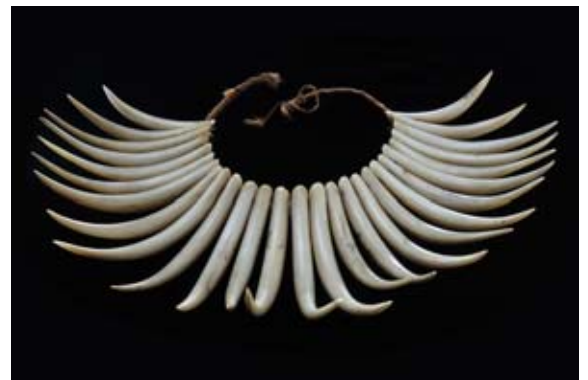
Collier en dents de cachalot, du XIXe siècle Iles Fidji

Dans le cadre des expositions de l'Art en Vieille-Ville le Cabinet d'Expertise Témoin s'intéresse cette fois-ci à d'anciens bijoux ethniques océaniques. De provenance de Polynésie ces bijoux souvent portés pour souligner son appartenance à un groupe social sont d'une rare beauté. Leur style épuré, les matières précieuses ou encore les ossements humains qui les composent, ainsi que l'extraordinaire savoir-faire que leur fabrication exigeait, participent aujourd'hui encore de leur grande valeur esthétique et continuent d'influencer le milieu des bijoutiers.