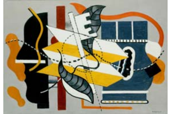
Fernand LEGER, Nature Morte, Profil Noir , 1928 Huile sur toile 65 x 92 cm

A travers une sélection d'artistes représentatifs de cette période qui prime le rêve, l'instinct, le désir et la révolte, le public pourra découvrir, entre autres, des tableaux de Fernand Léger, Francis Picabia, Yves Tanguy, Victor Brauner, Max Ernst, ou Salvador Dalí.