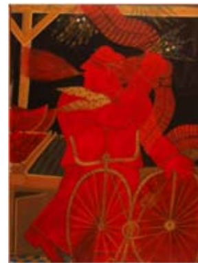
Alekos FASSIANOS, L'épicier fumant Huile sur toile

La Galerie Sonia Zannettacci propose une sélection de peintures de l'artiste grec Aleco Fassianos. Tout dans son œuvre nous ramène à la Grèce antique, les couleurs, la lumière, la forme des visages, les paysages etc... Une légère brise souffle sur les sujets ; des profils aux cheveux qui s'envolent, des cravates qui se dressent, donnent dans ces décors paisibles l'impression du mouvement : tout bouge mais rien n'a changé. Cette exposition est à découvrir jusqu'au 22 décembre à la Galerie Sonia Zannettacci.