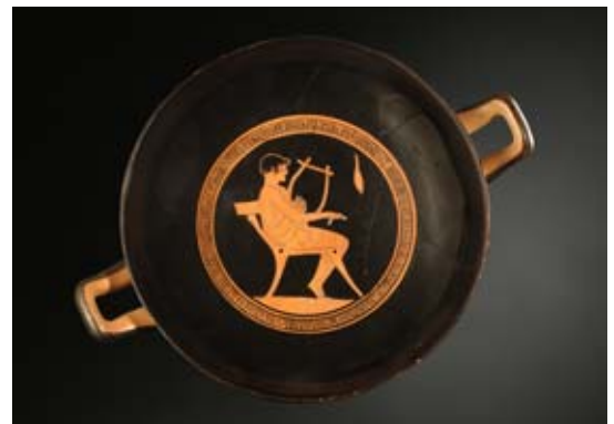
Coupe Antique, vers 460 av. J. C. Céramique , 24,5cm

Lorsque qu'ils ont pu être préservés et traverser les temps, c'est entre autre par l'objet que les mythes de l'antiquité nous sont parvenus pour nous révéler histoires et légendes. Le monde de la mythologie grecque en recèle énormément: monstres, guerres, intrigues et dieux inquisiteurs y sont nombreux. Chez les Egyptiens, les cérémonies et croyances liées à la mort représentaient une part importante de leur vie. Celles-ci étaient d'ordre religieuses. Ceux-ci devaient après leur décès vivre auprès des dieux un repos éternel en accédant au « royaume des morts ». Les Divinités étaient omniprésentes dans la vie quotidienne du peuple égyptien auprès desquelles il recherchait une protection.