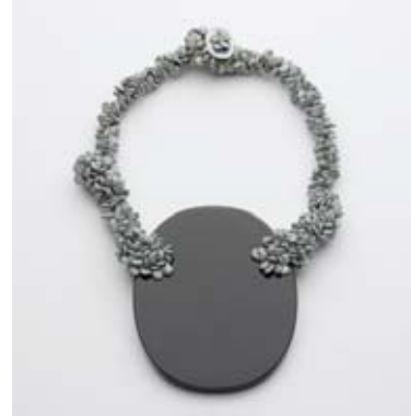
Iris BODEMER, Collier Ingrédients , 2008

La Galerie TACTILE spécialisée dans le bijou contemporain présente les œuvres récentes de deux créatrices allemandes de renommées internationales, présentes dans de nombreuses collections privées et publiques. Le travail d'Iris Bodemer offre une multitude de facettes et dépasse la seule fonction de bijou, il n'est plus uniquement un ornement, son œuvre acquiert un statut d'objet d'art à part entière. Le travail de Bettina Speckner est insolite car il emploie différents supports photographiques, des photos sur email ou des gravures à l'eau forte etc... et crée de nouveaux mondes en les associant à des gemmes, des coraux ou des perles. Cette exposition confronte leurs talents à transformer un dessin, une image, un instant en bijou.