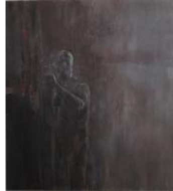
Ofer LELLOUCHE, Autoportrait , 2009

La Galerie Krugier & Cie consacre sa nouvelle exposition à l'artiste Ofer Lellouche. Né en 1947, Ofer Lellouche vit et travaille à Tel Aviv et Paris. Il étudie au Avni Institute of Art en Israël puis retourne à Paris, où il poursuit sa formation artistique à l'École des Beaux-Arts, sous la direction du sculpteur César. Depuis le début des années 1970, il présente régulièrement ses œuvres dans des expositions personnelles et collectives en Israël, en Europe, aux États-Unis et en Corée notamment. La Galerie Krugier & Cie le présente depuis 2002 lors des principales foires d'art internationales avec succès. En sculpture, il travaille sur différents supports dont le bois, le bronze et la céramique. Son travail s'articule autour d'autoportraits, corps, têtes sculptées, tronquées.