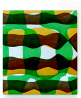
Philippe DELEGLISE, 3 figures de Chladni II , 2010, huile sur toile, 112x100 cm