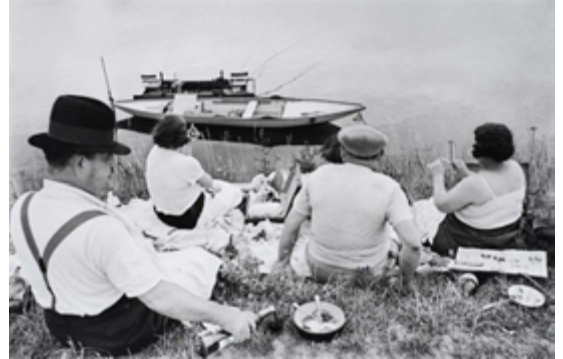
Henri CARTIER-BRESSON, Bord de Marne , 1938

Ces travaux sont d'abord une méditation sur le régime ternaire de la couleur. Ils convoquent trois types d'énergie, trois qualités de la couleur que sont le bleu, le jaune et le rouge. A ceci près que ces qualités n'apparaissent pas dans l'intensité triomphante d'une pureté séparée, abstraite, mais qu'elles évoquent la discrétion, l'anonymat d'un ferment. Elles se mêlent, favorisent une tendance, provoquent une inclination. Leurs principes actifs se diffusent et chacun d'eux prête son accent aux teintes les plus variées. à la présence active du plan.