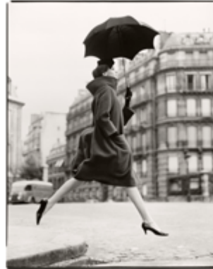
Richard AVEDON, Carmen (homage to Munkacsi), coat by Cardin, Place Francois-Premier, Paris, August 1957

Gagosian Gallery est heureuse de présenter une exposition des premières photographies de mode de Richard Avedon, représentant des femmes habillées en haute couture assises aux terrasses de cafés, dans les boîtes de nuit et dans les rues du Paris d'après-guerre. Parues dans Harper's Bazaar au sommet de son influence, les photographies d'Avedon ont été un élément fondamental dans le changement de la compréhension populaire de la mode. En effet, leur influence résonne encore dans les magazines de mode d'aujourd'hui.