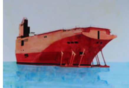
Yvan SALOMONE parcataules , 2007, aquarelle sur papier, 105 x 145 cm

Il est impossible de dire si ces paysages sont proches ou lointains, d'ici ou d'ailleurs : les conteneurs, qu'ils soient prêts à charger de l'or ou des déchets, à Saint-Malo ou à Hong Kong, sont les mêmes, porteurs de travail, d'espoir, de dangers. Et bien que l'homme n'apparaisse jamais dans les paysages souvent ingrats que décrivent ses aquarelles, elles exhalent un puissant parfum d'humanité.