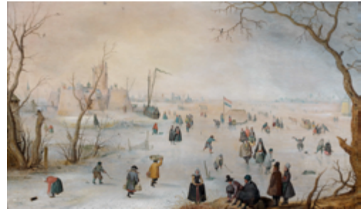
Hendrick AVERCAMP, Amsterdam 1585 - Kampen 1663 Paysage d'hiver avec patineurs aux environs de Kampen Panneau : 39 x 66 cm

Depuis 1976, la galerie De Jonckheere règne sur le marché de la peinture flamande. Installée à Bruxelles, à Paris sur le faubourg Saint Honoré et désormais au cœur du quartier historique de Genève, la galerie présentera pour son deuxième accrochage genevois ses dernières acquisitions. Les grands peintres flamands des XVIe et XVIIe siècles seront au rendez-vous, et les écoles françaises et italiennes ne manqueront pas à l'appel. On y célébrera la grande dynastie Brueghel, tout comme Lucas Cranach, entre portraits et scènes bibliques. A ne pas manquer !