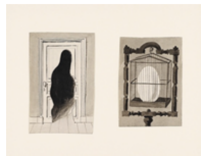
René MAGRITTE La réponse inattendue et Les affinités électives 1933, encre et crayon sur papier, 10,4 x 5,6 et 9,2 x 6,3 cm

Les principaux artistes du mouvement seront représentés à travers une ou plusieurs œuvres sur papier, tel Bellmer, Brauner, Domínguez, Ernst, Herold, Hugnet, Lam, Magritte, Masson, Matta, Picabia, Pollock, Styrsky et Tanguy.