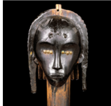
Tête de reliquaire. Fang, sous-style Betsi

L'Art en Vieille-Ville bénéficie comme toujours du soutien du Musée Barbier-Mueller qui nous invite à découvrir une exposition exceptionnelle. Objet de fascination pour les navigateurs d'abord, puis, dès l'aube du XXe siècle, pour les artistes et collectionneurs occidentaux séduits par l'expressivité de ses formes inventives, l'art du Gabon dévoile ses richesses et son niveau d'abstraction par l'entremise des œuvres rares et emblématiques de la collection Barbier-Mueller, exposées pour la première fois dans les salles du musée de la Vieille-Ville.