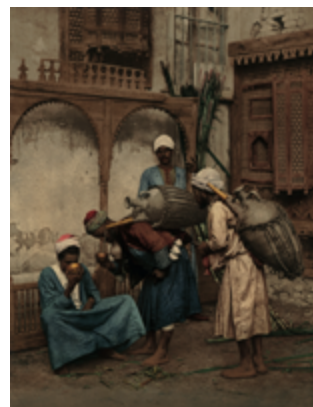
" Le Caire, marchand d'eau fraîche, vers 1870

Famille lapone, guide de montagne, porteurs d'eau indiens, marchandes de lait aigre, une autre façon de voyager. A ne pas manquer !