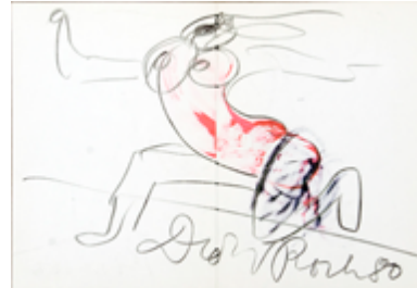
Dieter ROTH Selfportrait as Sprinter, 1980 Techn. mixte sur papier Format 22,9 x 32,8 cm

Dieter Roth a été l'un des grands artistes universels du XXe siècle. Il était graphiste, il a dessiné des meubles, il a peint, sculpté et réalisé des installations monumentales, il a utilisé tous les matériaux possibles et imaginables, il était poète et musicien, il a édité des livres d'art, il a filmé, photographié, collectionné, etc. L'exposition s'entend ainsi comme une contribution à l'étude de l'œuvre de Dieter Roth d'une part, elle ouvre le débat sur l'autoportrait d'autre part, sujet remis en question par bien des artistes dans la deuxième moitié du XXe.