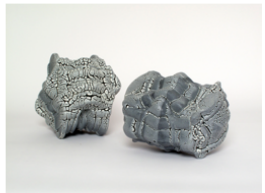
Philippe BARDE, Stone wear , 40 x 20 cm, émail magnésique, 2011 Stone wear , 20 x 50 cm, émail magnésique, 2011

L'artiste genevois, né en 1955, pousse depuis de nombreuses années l'expérimentation en céramique vers les limites du genre, et au-delà. Par un travail de recomposition d'éléments trouvés, il superpose les références au médium, aux traditions culturelles issues de ses voyages et aux stratégies de l'art contemporain.(...) Dans la série récente « stone wear » il inflige aux formes Art déco des traitements d'émaux rétractés et brûlés par la chaleur des fours selon les techniques ancestrales de l'Art du Feu oriental. Barde nous rappelle ainsi qu'entre un moulage et une empreinte photographique, la reproduction de l'environnement et de la culture touche autant l'art de la céramique, que les arts dits des nouveaux médias.