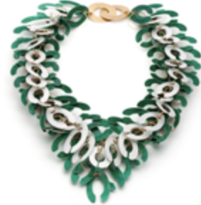
Ralph BAKKER, Collier "Acer Superior" 2010 or, argent, émail

Les bijoux de cet artiste, né en 1958, sont ancrés dans la tradition de l'orfèvrerie, il travaille l'or, l'argent, le nielle et l'émail. Ralph Bakker exagère, redimensionne, joue avec les couleurs et s'amuse de la complexité de son art pour créer des œuvres résolument contemporaines. Ces parures structurées par des assemblages en cote de mailles, demandent à être portées car elles se révèlent fluides et sensuelles au contact de la peau.