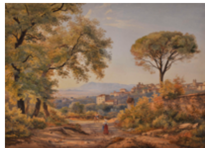
Salomon CORRODI (1810 - 1892) "Frascati" Aquarelle signée "Corrodi. Rome" en bas à droite, 39 x 54cm