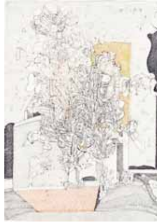
Philip SCHIBIG, container ou sablier, 1980 Stylo bille sur papier, 29,7 x 21 cm

Philippe Schibig est l'un des artistes phares de l'art contemporain suisse des années 1960-70. Son expression picturale, unique en son genre, se compose de couches dessinées superposées, faites de traits microscopiquement ciselés au stylo bille qui, dans un chaos organisé et une frénésie contrôlée, dégagent une intensité incomparable, alors que la clé de lecture de son œuvre se dévoile sans cesse au regard.