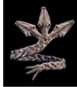
Bracelet rituel thâama to'ro, insigne d'un ministre de culte. Bronze. D. : 11 cm ; H. : 15 cm. Musée Barbier-Mueller, Genève.

L'exposition « Gan, royaume méconnu d'Afrique » met à l'honneur la riche production d'emblèmes et d'objets de culte en « bronze » finement ouvragés du peuple Gan, dédiés aux puissances tutélaires de son royaume. Les Gan représentent une petite population de quelque six mille sujets, voisine des Lobi, implantée dans le sud-ouest du Burkina Faso, dont les ancêtres auraient quitté le Ghana pour des motifs politiques et religieux au cours du XV e siècle.