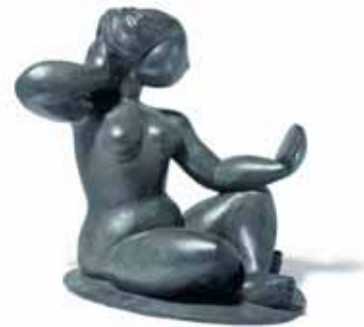
Baltasar LOBO, Femme au miroir, 1940-1991 Bronze, 63 x 48 x 57,5 cm

La galerie Interart présente cet automne une trentaine de sculptures de l'artiste espagnol Baltasar Lobo (1910-1993) dont elle soutient le travail depuis de nombreuses années. L'exposition illustrera les différentes périodes figuratives du sculpteur qui célèbre la vie et la femme, éternelle référence et source d'inspiration sans cesse renouvelée. A l'abri des influences et des modes de son temps, Lobo développe un style personnel caractérisé par une harmonie des courbes et des rythmes et une formidable maîtrise des matériaux. Sa sculpture s'inscrit à la fois dans et hors du temps et transmet un sentiment radieux de plénitude des formes et d'aboutissement, rarement égalé.