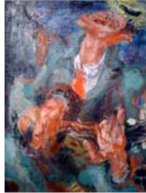
Gen PAUL Joueur de banjo ou Canotier , 1928 Huile sur toile 81 x 60 cm