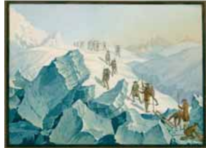
Johann-Peter LAMY, "Montée de Mr de Saussure sur la cime du Mont-Blanc au mois d'Août 1785" "Descente de Mr de Saussure de la cime du Mont-Blanc au mois d'Août 1785" Paire d'aquatintes gouachées 11,2 x 15,5 cm

Horace-Bénédict de Saussure atteindra à son tour le toit des Alpes l'année suivante. Dès lors les ascensions se succèdent car cette montagne réputée "maudite" fascine. Dès la fin du XVIIIe siècle de nombreux artistes l'ont immortalisée à travers des dessins, aquarelles, gouaches et gravures tant recherchées aujourd'hui.