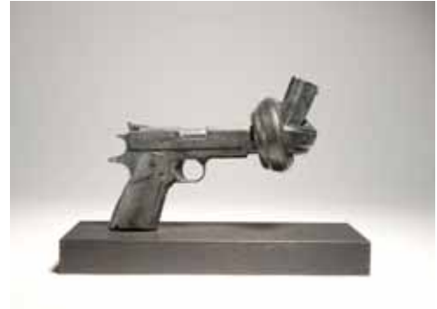
Carl Fredrik REUTERSWARD, "Non Violence", 1980, bronze, 1/3, 19 x 26 x 10 cm