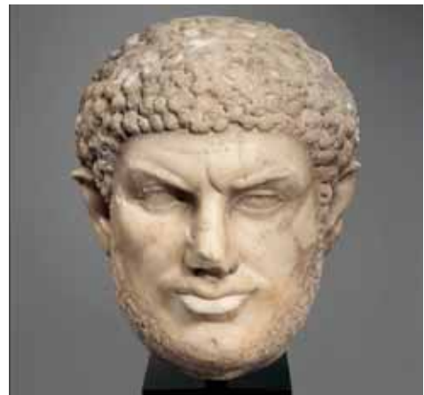
L'empereur Caracalla (?) (211-217 apr. J.-C.) Art romain, début du IIIe s. ap. J.-C. Marbre blanc à grain fin H 25 cm Provenance : Ancienne collection particulière suisse, début des années 1990.

Phoenix Ancient Art innove encore une fois et propose une ample palette d'objets de grande qualité dont le dénominateur commun se situera en particulier dans leur différence de taille, parfois énorme, de matière et de culture et qui seront groupés dans un choix limité de sujets. La galerie essaiera de désigner les « convergences » entre une magnifique statuette de panthère en cristal de roche, œuvre d'un artiste mésopotamien, un camée romain représentant un lion avec sa proie et une grande gouttière en pierre... etc Voilà quelques thèmes conducteurs qui permettent de présenter côté à côté des œuvres de diverses origines, matières et dimensions, les plus petites pièces - par la taille ! - atteignant souvent la quintessence de l'esthétique classique.