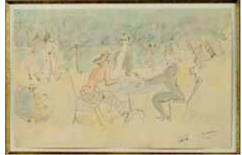
PASCIN, Jardin Public Aquarelle sur papier 26 x 17 cm, vers 1912 Vers