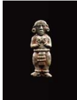
Pendentif représentant un personnage debout, Honduras

L'Art en Vieille-Ville bénéficie comme toujours du soutien du Musée Barbier-Mueller qui nous invite à découvrir cette très rare exposition : Bijoux de l'Homme Bijoux de la Terre, réunissant des bijoux de la main de l'homme qui côtoient des minéraux et des créations de la terre.