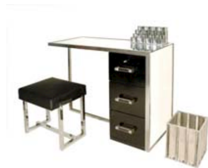
Jacques ADNET, Bureau Moderniste, vers 1932

Une sélection d'objets, de luminaires et de meubles de Jacques Adnet, des années 1920 à 1959 est à découvrir jusqu'au 31 juillet 2010. Jacques Adnet ne cherche pas à rattacher l'art du présent aux styles du passé, mais à trouver dans la décoration des analogies avec le XXe siècle, cette ère nouvelle où l'on ne jure plus que par la machine, la vitesse, l'avion et l'électricité. C'est la raison pour laquelle, en véritable architecte décorateur se préoccupant aussi bien de l'infime détail que de la répartition des volumes, Jacques Adnet réunit au sein de la Compagnie des Arts Français une remarquable équipe de peintres, aussi de verriers, de dinandiers et de bijoutiers, de céramistes ou de ferronniers.