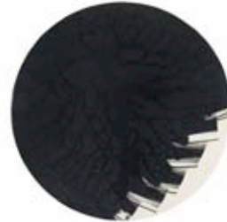
FRANKLIN CHOW, Sans titre, 2009

Il utilise une technique mixte, mélangeant encre de chine et huile pour des peintures aux matières délicates, aux tonalités sourdes et aux tons délibérément limités (noir, gris, blanc).