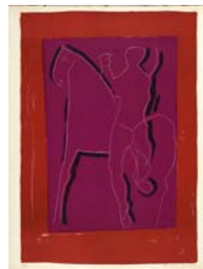
Marino MARINI, L'homme et le cheval, 1955 Lithographie

Les amateurs de beaux dessins anciens et de peintures représentant des paysages et personnages trouveront également leur bonheur accroché aux cimaises de la galerie.