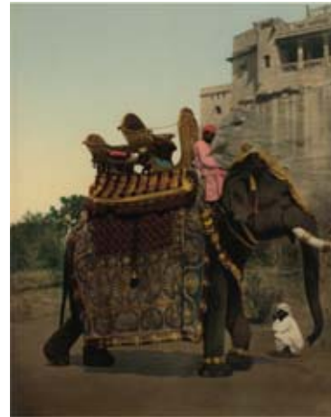
Anonyme, Government Elephant in State Costume , 1897 Photochrome

L'œil du photographe puis l'interprétation du lithographe nous donnent une image d'un monde à la fois proche et poétique qui ne peut nous laisser indifférents.