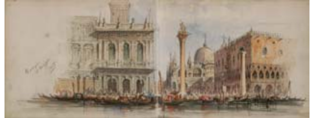
Amadeo PREZIOSI (1816 - 1882)

Ces vues constituent une référence essentielle et ces peintres voyageurs en sont les auteurs. Atteints par le démon du voyage ils ont mené de véritables expéditions à une époque où voyager était une aventure. Un bel ensemble de vingt esquisses par Preziosi est un des lots phares de l'exposition, suivi, entre autres, d'une rare vue de Louxor par Lear, de majestueuses planches sur Rome de Ducros et de lumineuses aquarelles