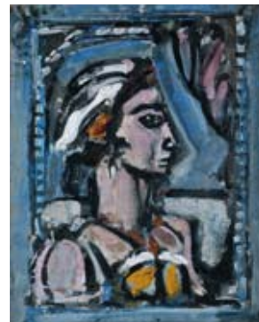
George ROUAULT, Je suis belle, ô mortels, Les Fleurs du Mal, vers 1930 Gouache et Huile sur papier maroufflé sur toile.

En ce printemps 2010, la galerie Interart a choisi de présenter l'œuvre picturale de Georges Rouault (1871-1958) à travers une sélection d'une vingtaine d'huiles sur toile réunies autour du thème du portrait et des personnages. Contemporain des Fauves et des Expressionnistes, cet élève de Gustave Moreau n'a toutefois jamais revendiqué une quelconque appartenance à l'un de ces mouvements. Influencé par l'art médiéval du vitrail qui fut sa première formation, il a développé un travail unique emprunt d'une grande force. Rouault aborde des thèmes liés à une observation critique de la société et cherche dans ses portraits à cerner la vérité profonde du personnage ; ses clowns et ses acrobates de cirque, ses juges et ses avocats tout comme ses nus et ses figures religieuses sont empreints d'un profond humanisme, reflet de l'artiste lui-même.