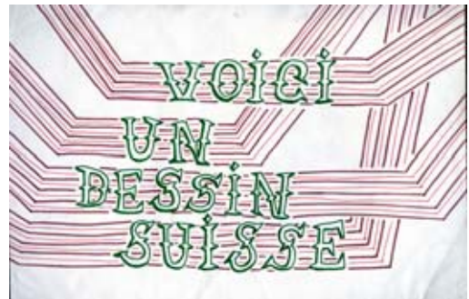
Genet MAYOR, Sans titre , 2004

Les formes contemporaines du dessin attestent une évolution fascinante qui ne limite plus ce médium au simple témoignage du processus créatif. À travers la richesse de ses propositions, le dessin se frotte aux autres formats dans une hybridité parfois inattendue. Libéré du format intime de la feuille de papier, il rejoint les champs de l'art monumental, de l'installation, de l'animation, les modes d'impression de l'estampe - notamment avec le dessin vectoriel -, le langage de la bande dessinée ou encore le Street Art. L'exposition réunit les œuvres d'une quarantaine d'artistes issus des différentes régions de Suisse.