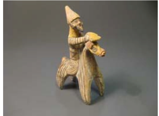
Cavalier portant un animal à son bras Art Chypriote, 850-600 Av J.-C.

L'ensemble des pièces qui seront présentées comporte différentes catégories d'objets : de la statuaire, surtout de plus petites et moyennes dimensions, aux vases en céramique avec des scènes peintes, des mosaïques ou encore, des reliefs en marbre, le cheval a permis à d'innombrables artistes, provenant des quatre coins du monde antique d'exprimer leur immense talent, et surtout, ce sont des témoignages que nous avons le privilège de pouvoir encore apprécier de nos jours.