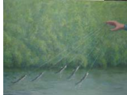
OLIVIER O. OLIVIER, Pêche 2008