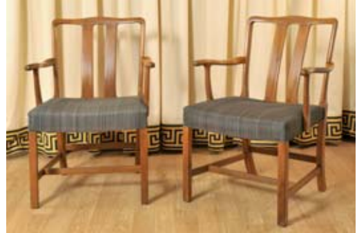
Fauteuils d'Ole Wanscher pour Fritz Hansen, Danemark, années 40