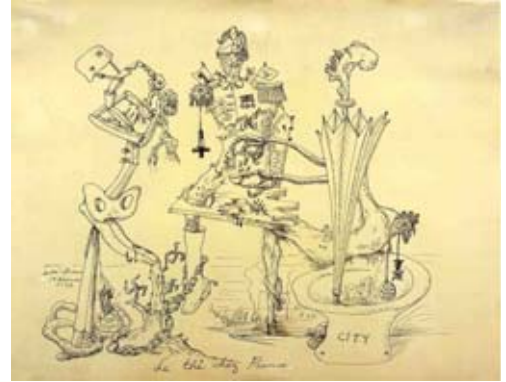
André MASSON, Le Thé chez Franco , Encre sur papier 45,5 x 58 cm